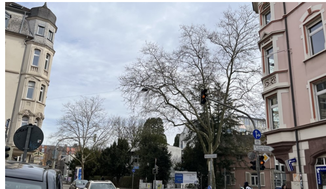
Heutige Situation an der Kreuzung

Der Verzicht auf das Pförtnerhäuschen ermöglicht eine wesentliche Verbesserung der Situation und orientiert sich an den Vorgaben des Bauflichtenplans.